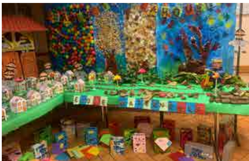
Exposition Art & Artisanat

Le temps d'un bel été pour reprendre des forces et redémarrer avec 75 élèves, tous motivés pour de nouvelles aventures au fil des contes traditionnels. L'année scolaire débute avec un projet collaboratif intitulé 'pirouette cacahouète' réalisé par les élèves des trois classes dans le cadre de l'exposition Art et Artisanat. Les projets s'enchaînent : ateliers culinaires, sortie au cinéma, visite du Saint-Nicolas, puis celle du père Noël... De nombreux projets sportifs et artistiques se préparent encore et annoncent une année 2024 riche en expériences et en souvenirs, que nous ne tarderons pas à partager lors d'une nouvelle fête d'école qui sera organisée fin juin.