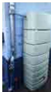
Exemple de dé raccordement et mise en place de cuve de récupération des eaux