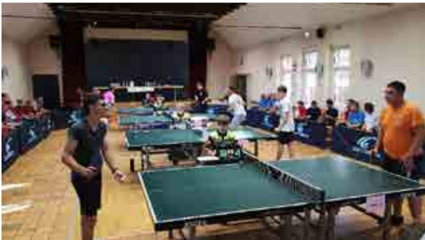
tennis de table au saessemer fescht