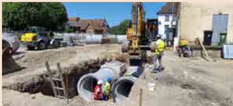
Travaux de déraccordement place de la Mairie à Sessenheim