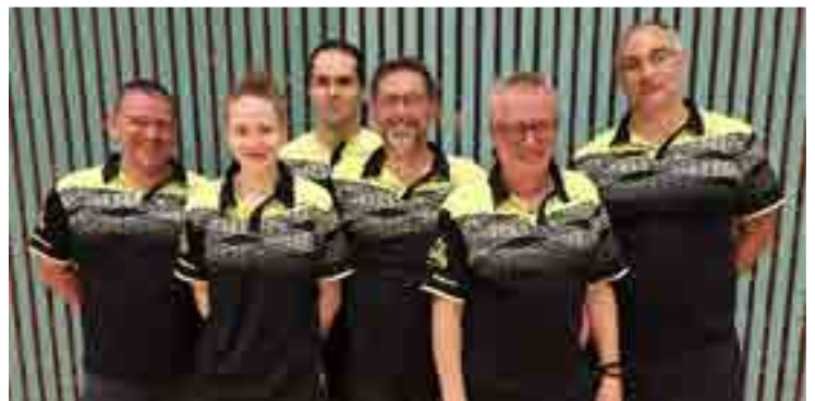
Équipe 1 championne d'alsace