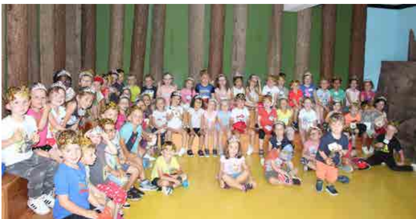
Sortie au Château du Fleckenstein