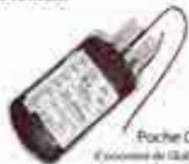
Poche CGR (Concentré de Globules Rouges)