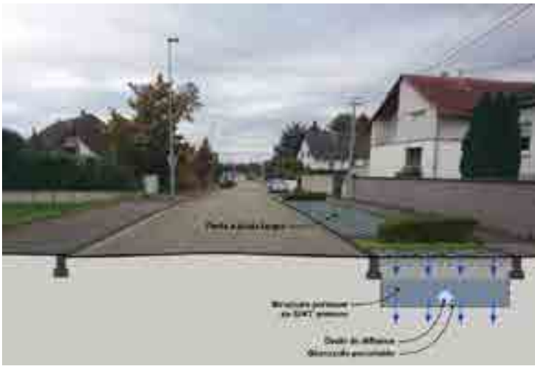
Principe d'aménagement secteur de l'Alliance